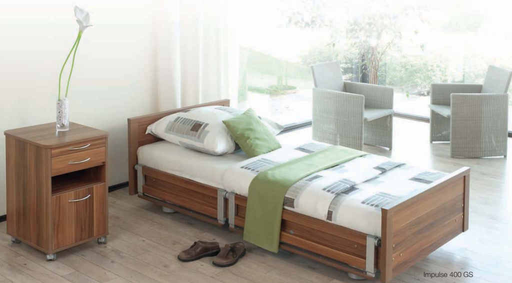
Impulse 400 GS