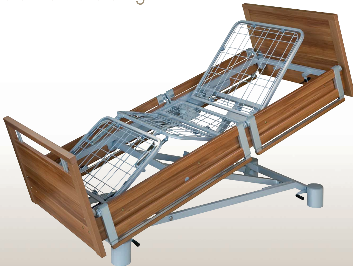
Impulse 400 GS