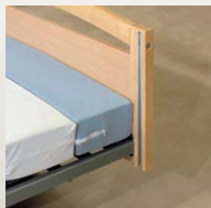
Matratzenkeil mattress block V8 12 001