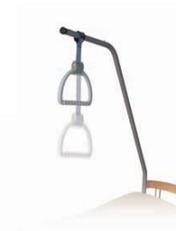
Haltegriff höhenverstellbar handhold height adjustable V5 02 000