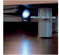
Unterbettbeleuchtung Modell Terra light lamp „terra light“ V8 02 004