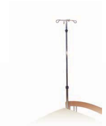
Infusionsstativ Aufnahme Metall infusion tripod V8 03 000