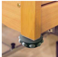
Wandabweiser – horizontal + vertikal wall deflector – horizontal and vertical V8 01 001