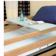
Bett-Tableau bed tray V7 01 001