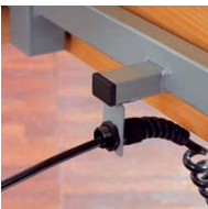
mechanische Zugentlastung mechanical strain relief STANDARD