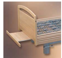
Bettzeuglade Bed things file V8 20 000