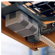
zusätzliche Stromversorgung additional current distribution V8 13 000