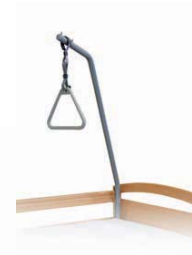
Haltegriff handhold V5 01 000