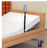
flexible Handschalterbefestigung flexible holder for hand control unit V8 19 000