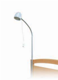
Bettlampe für Aufnahmehülse Modell Halolux-E lamp „HALOLUX-E“ V8 02 002

Betten Malsch GmbH · Rohbergstraße 9 · 36208 Wildeck-Obersuhl · GERMANY Telefon: +49(0)6626 / 915 100 · Telefax: +49(0)6626 / 915 116 · www.bettenmalsch.de · info@bettenmalsch.de