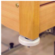
Wandabweiser – horizontal wall deflector – horizontal V8 01 002