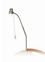
Bettlampe für Aufnahmehülse Modell Halolux-W lamp „HALOLUX-W“ V8 02 003