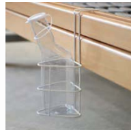
Urinflasche + Korb urinebottle + holder V8 11 000