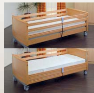
3-teiliges Seitengitter 3-bar cotside OPTIONAL